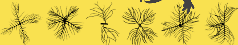
M. verticillatum M. heterophyllum M. humile M. sibiricum M. verticillatum M. sibiricum